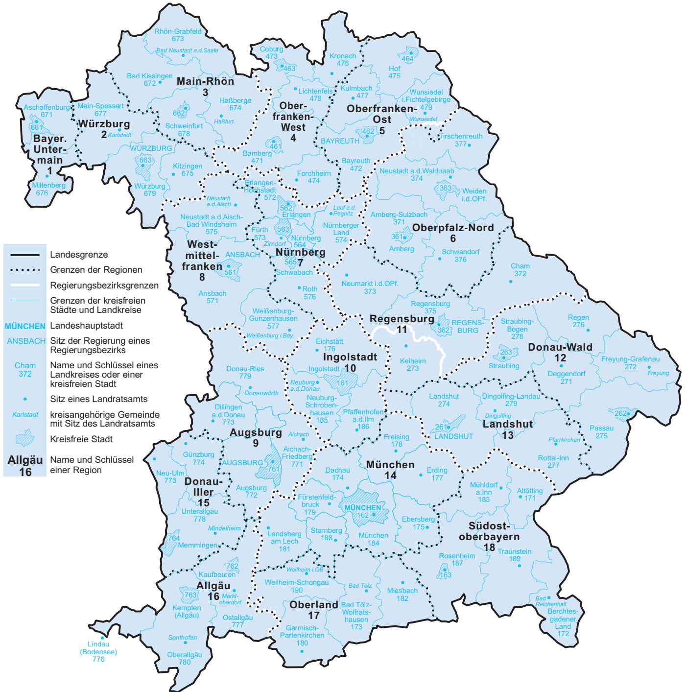
Abb. 2 Regionen Freistaat Bayern Stand: 31. Dezember 2016